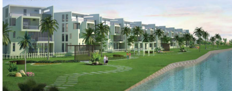
Phối cảnh dự án Villa Park